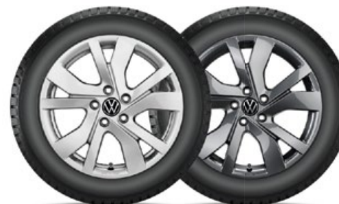
VW Rockingham Silber