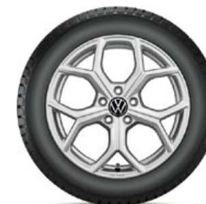
VW Huntsville Silber

Alle abgebildeten Winterkomplettäder (WKR) für den neuen Tiguan haben keine Reifendruckkontroll-Sensoren (RDKS). Falls Ihre Fahrzeugausstattung dies erfordert, sind WKR mit RDKS zu wählen. Beachten Sie bitte den Aufpreis. Ihr Volkswagen Service-Betrieb informiert Sie gerne.